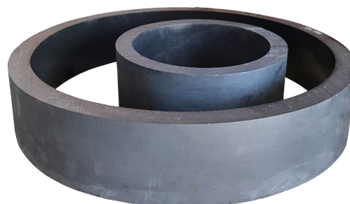
TECAST T MO черный (PA6C+MoS2)

LAMIGAMID 1209 желтый – отличная стабильность размеров и хорошая стойкость к износу + более широкий диапазон рабочих температур в сравнении с TECAST T, TECAST T MO черный и LAMIGAMID 314 черный.